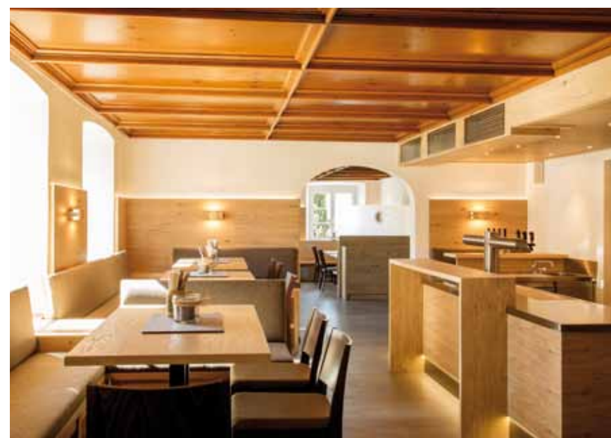
Auch die Ausstattung der Gasträume eines Hotels ist für Wagner Möbel kein Hindernis - sondern Auftrag, Aufgabe, Herausforderung.

tinuierlich erweitert. In der hauseigenen Polsterei wird man heute dem Relaunch der alten Sofalandschaft ebenso wie der neuen Wandbespannung gerecht. Die Designer entwerfen werbliche und dekorie-