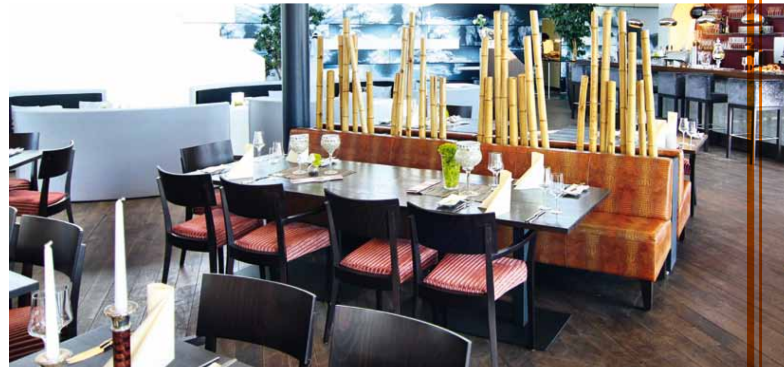
Wagner Möbel fertigt auch individuelle Prints & Plots... vom Teppich bis zur Decken- oder Wandtapete.

rende Folienplots für das Ambiente. Die Raumausstattung wird stimmig aus einer Hand komplettiert - Teppiche, Vorhänge ... bis zum Kissenbezug.